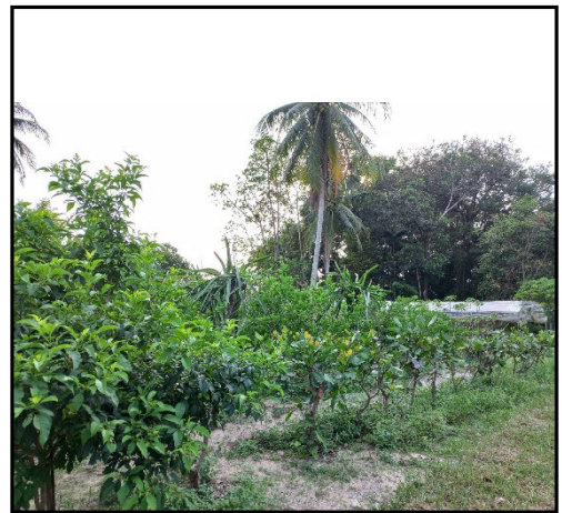
ภาพแสดง : การปลูกสมุนไพรรไทย

เพื่อส่งเสริมการเรียนรู้ทางการสร้างความมั่นคงทางอาหารและสร้างรายได้ให้กับประชาชน