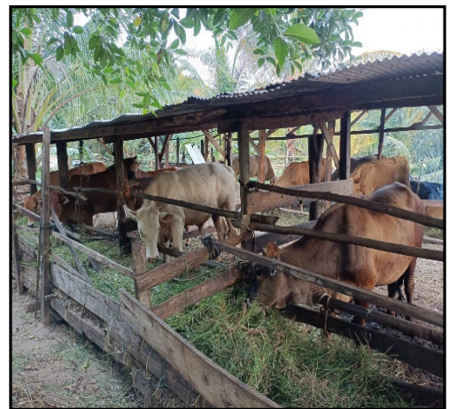
ภาพแสดง : กิจกรรมการเลี้ยงแพะนมและการเลี้ยงโคเนื้อ เพื่อเป็นแหล่งเรียนรู้และศึกษาดูงานในการจัดระบบการเลี้ยง

๑. ชื่อกิจกรรมฐานเรียนรู้ การเลี้ยงแพะนม/การเลี้ยงโคเนื้อ