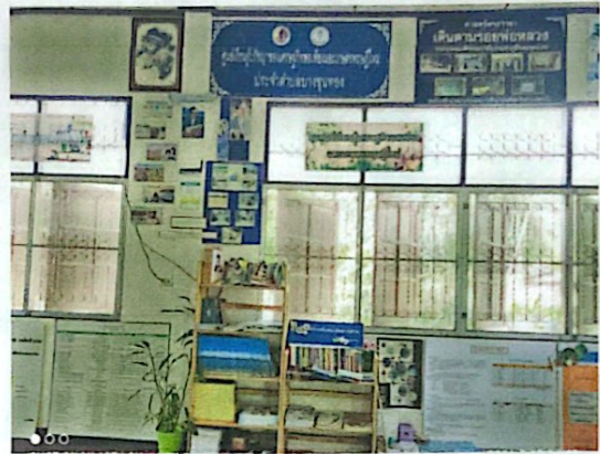
มุมศูนย์เรียนรู้เศรษฐกิจพอเพียงและทฤษฎีใหม่