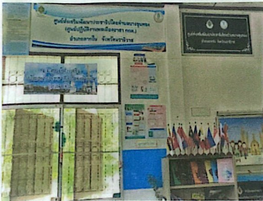
มุมศูนย์ส่งเสริมพัฒนาประชาธิปไตย (ศส.ปชต)