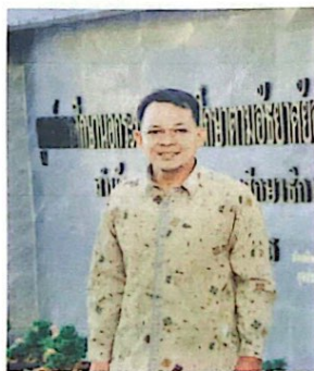
นายไมฮัมหมัดรูสดี สาและ

๑๐. มีการนำเสนอข้อมูลพื้นฐานของ กศน.ตำบล เป็นปัจจุบัน