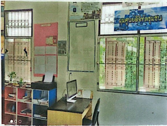
มุมศูนย์ดิจิทัลชุมชน