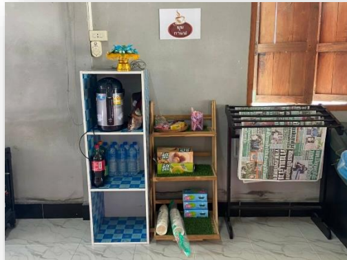
รูปภาพ : มุมเรียนรู้ประจำสถาบันศึกษาปอเนาะอัลมูฮำมาดีวิทยา