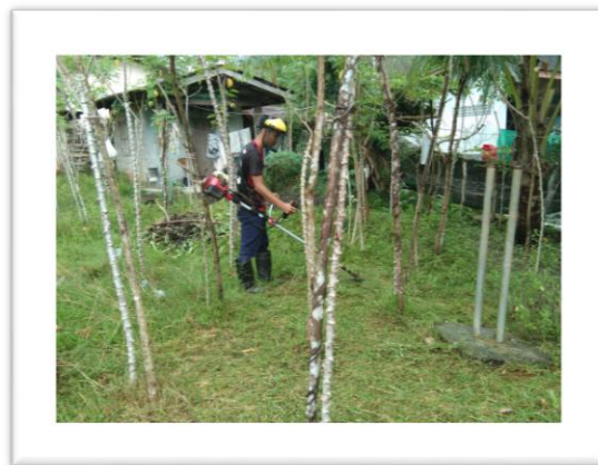
ประชาชนชุมชนบ้านกุจิงลือปะตัดหญ้าหน้ากศน.ตำบล