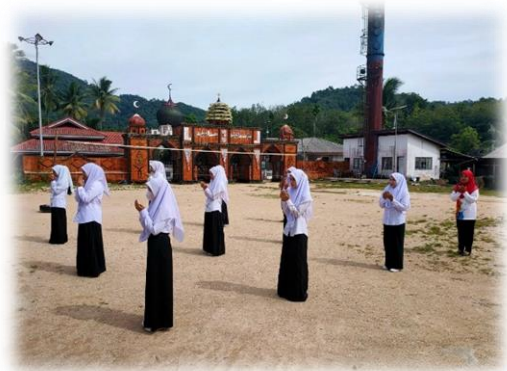
นักศึกษาร่วมเคารพธงชาติ