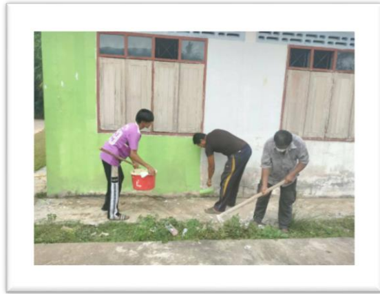
ประชาชนชุมชนบ้านกุจิงลือประร่วมอรร่วมใจทาสี กศน.ตำบล