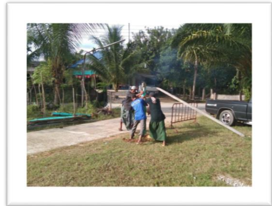
ประชาชนชุมชนบ้านกุจิงลือปะให้ความร่วมมือในการขนย้ายเสาเพื่อทำจุดเช็คอินที่กศน.ตำบล