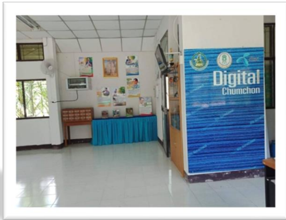
๔.๒ มีการจัดข้อมูลสารสนเทศ