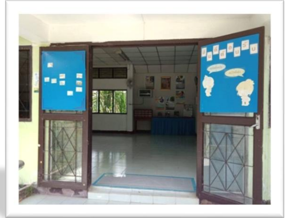
๔.๑ มีมุมอ่านหนังสือในห้องเรียน