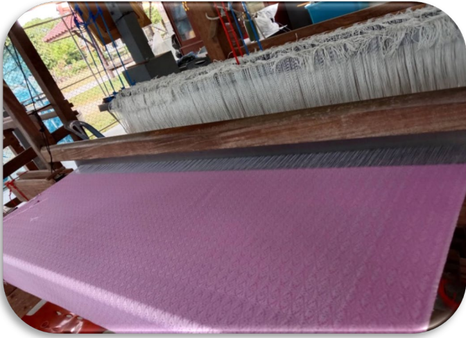
(ลายเชิงเขา)